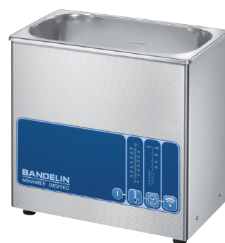
DT 100 H